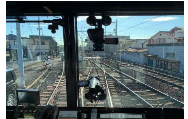
撮影状況（叡山電鉄様）

※目安ですので撮影場所、交通事情、運行ダイヤ、天候、カメラ設置条件、撮影対象、使用カメラ等により前後します。