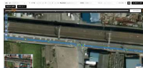
4D-db ® 地図検索画面